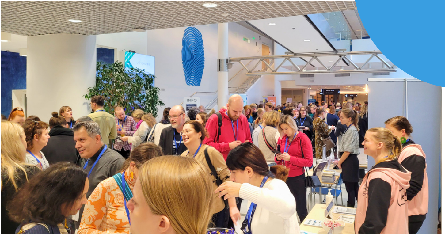
Moniheli on mukana mahdollistamassa verkostoitumista Integration-tapahtumassa 2024.

Tavoitteena on mahdollistaa jäsenjärjestöjen yhteistä toimintaa ja yhteistyön käytäntöjen kehittämistä. Aloitteiden tulee olla kolmen jäsenjärjestön yhdessä ehdottamia, ja ne voivat koskea mitä tahansa yleishyödyllistä asiaa, joka edistää yhteistä hyvää, ja joka on Moniheli-verkostolle tai sen taustalla oleville yhteisöille hyödyllistä.