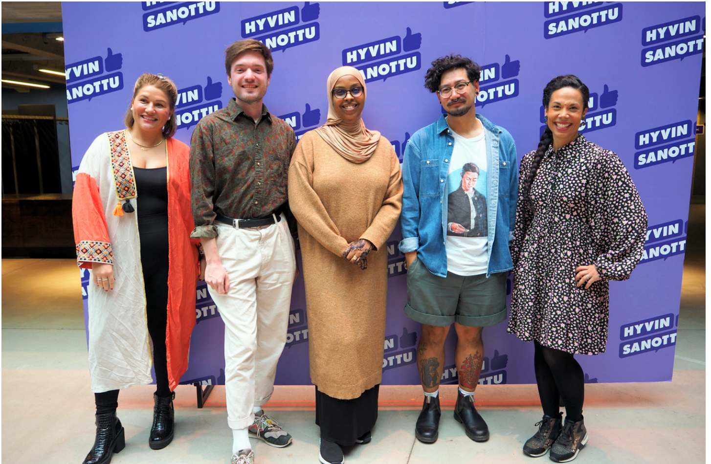
Moniheli aikoo osallistua Hyvin sanottu -puhefestivaaleille myös vuonna 2024.

Moniheli on tärkeä viestinnän ja vaikuttamisen yhteistyökumppani julkiselle hallinnolle, järjestöille ja medialle. Kauttamme levitetään tietoa, tavoitellaan kohderyhmiä ja vahvistetaan omia viestejä sekä opitaan vaikuttamistyön perustaitoja. Vuonna 2024 Moniheli vahvistaa vaikuttamistyön käytäntöjä ja koordinoi yhteistä viestintää ja vaikuttamista verkostonsa kanssa.