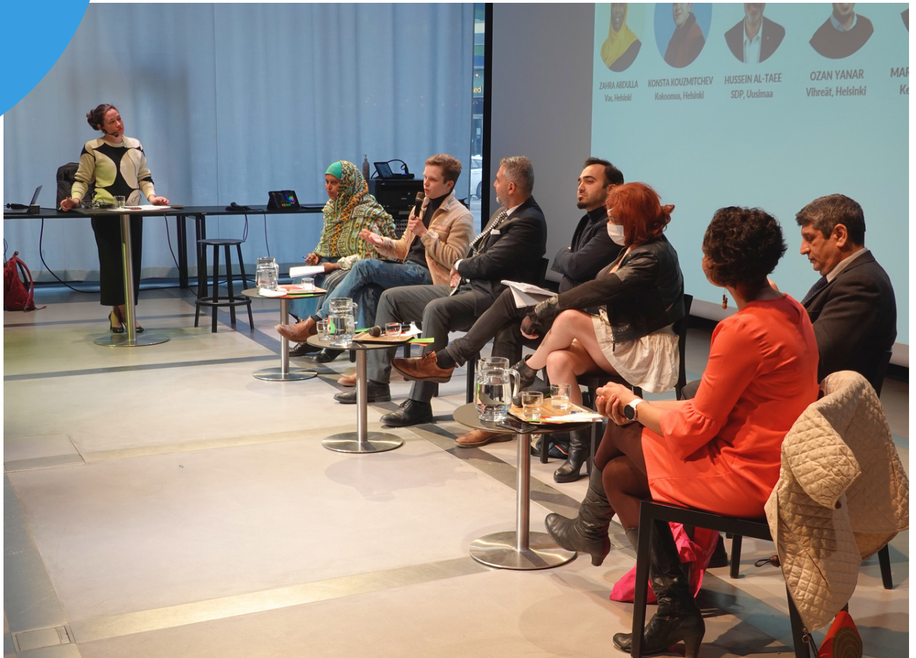
Vuonna 2024 Suomessa on sekä presidentinvaalit että EU-vaalit.