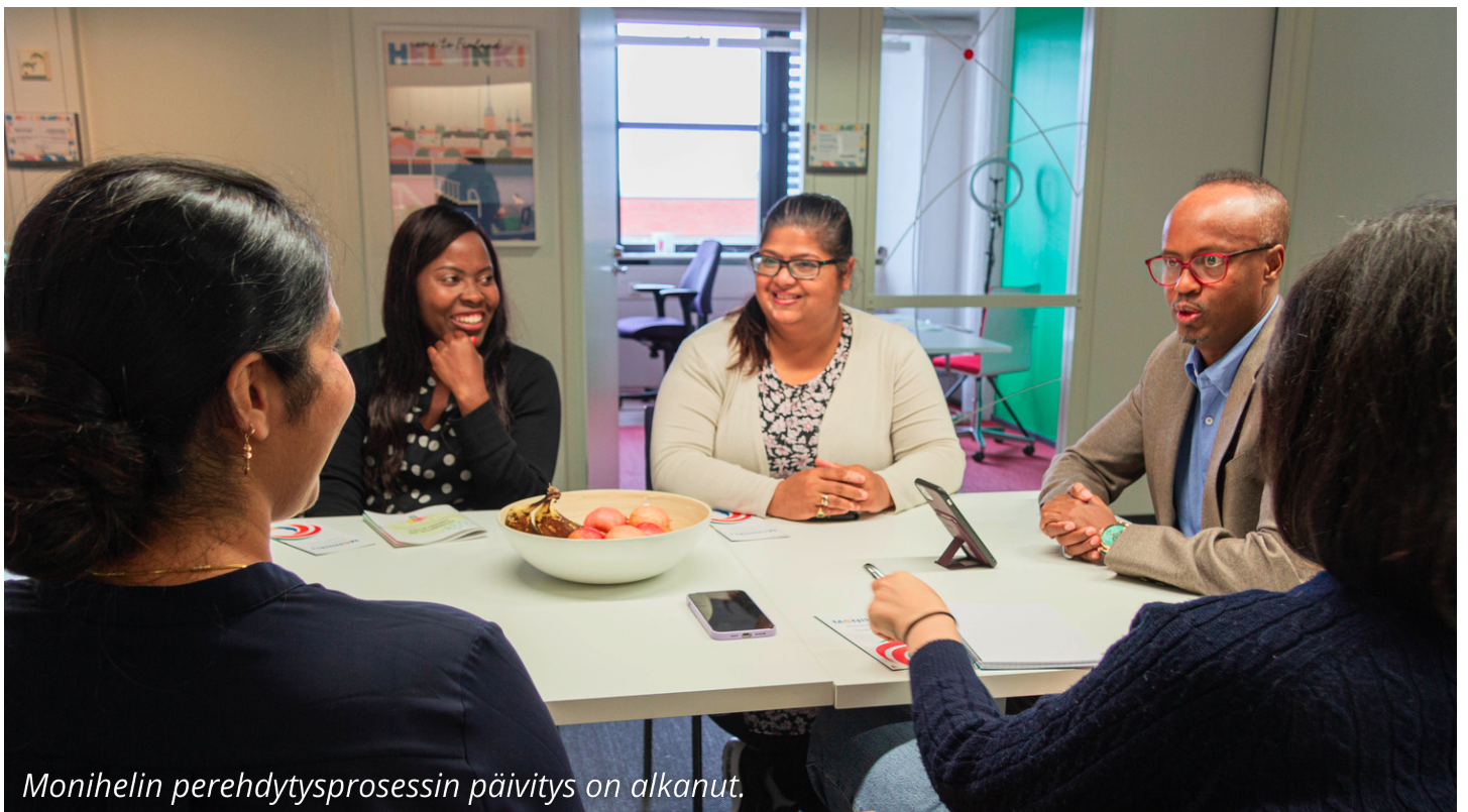
Monihelin perehdytysprosessin päivitys on alkanut.

Moniheli kehittää jatkuvasti perehdytysprosessiaan. Toimiva ja mielekäs perehdytysmateriaali helpottaa työntekijän sopeutumista yhteisöön ja tukee omien tehtävien suorittamista. Uusien työntekijöiden lisäksi Monihelissä on vuosittain noin 15 vieraskielistä harjoittelijaa, joiden perehtyminen pyritään tekemään mahdollisimman helpoksi. Hallinnon prosessien sujuvoittaminen onkin työkuormituksen kannalta erittäin tärkeää. Vuonna 2024 kehitämme taloushallinnon käytäntöjä ja sisäistä tietopankkia, jotta uusien työntekijöiden ja harjoittelijoiden perehdytys on sujuvaa, ja vanhatkin työntekijät tietävät, mistä työn kannalta tärkeät asiat löytyvät.