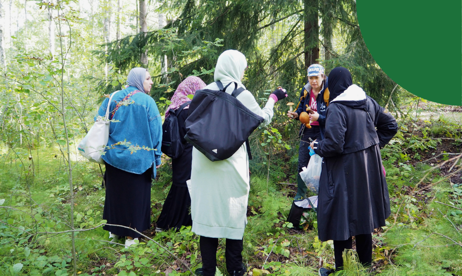
Luontokoti sieniretkellä Helsingin Herttoniemessä yhdessä FINN-MAMU Monikulttuurinen ry:n kanssa.

kotoutumista tukevien toimijoiden kanssa yksilöllisesti jokaiselle osallistujaryhmälle. Kurssisarjat voivat koostua retkistä luontoon, luennoista tai muusta tietoa ja hyvinvointia lisäävästä toiminnasta. Mukana olevilla alueilla järjestetään myös yhteisöllisiä luontotapahtumia.