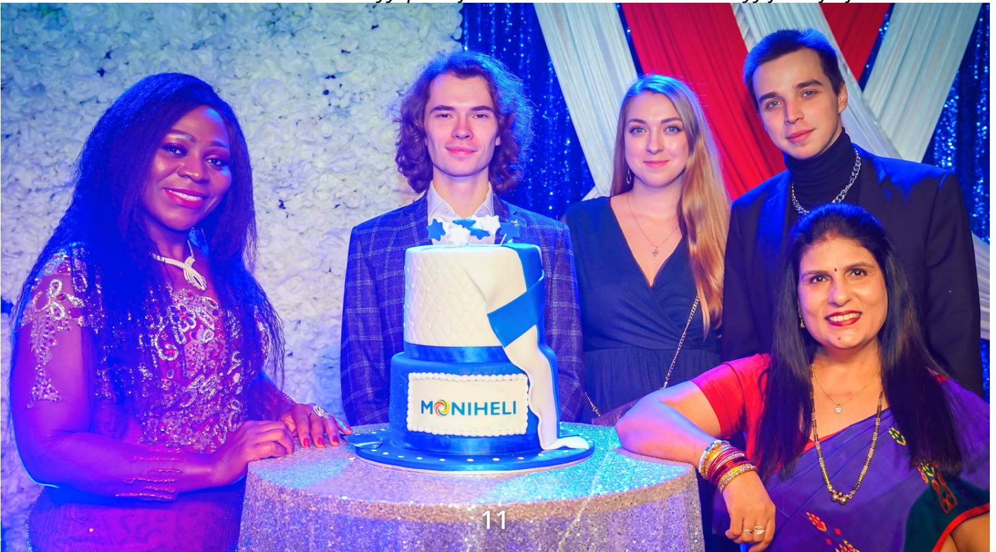
Vuonna 2024 Monikulttuurisen itsenäisyyspäiväjuhlan toteuttamisvastuu siirtyy jäsenjärjestöille.

Vuoden 2024 alusta Monikulttuurisen itsenäisyyspäiväjuhlan toteuttamisvastuu siirtyy kokonaisuudessaan jäsenjärjestöille yhtenä Verkoston aloitteena. Moniheli tukee tilaisuuden järjestämisestä vastaavia järjestöjä sekä suunnitteluprosessissa että käytännön järjestelyissä.